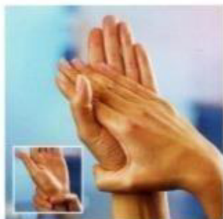
Ладонь к ладони, включая запястья

При гигиенической обработке рук следует соблюдать определенную технику, поскольку специальные исследования показали, что при проведении гигиены рук определенные участки кожи остаются контаминированными. Так, при гигиене рук чаще всего пропускаются следующие участки кожи: кончики пальцев (наиболее контаминированы, т.к. все действия осуществляются при помощи кончиков пальцев); межпальцевые промежутки, большой палец (редко подвергаются воздействию при проведении гигиены рук). Таким образом, техника гигиены рук предусматривает обработку всех участков кожи рук