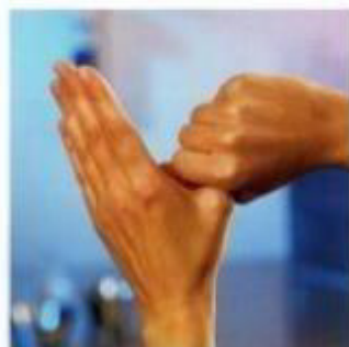
Кругообразное растирание левого большого пальца в закрытой ладони правой руки и наоборот