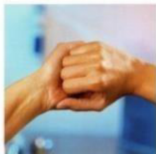
Внешняя сторона пальцев на противоположной ладони с перекрещенными пальцами