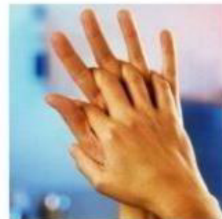
Ладонь к ладони рук с перекрещенными пальцами