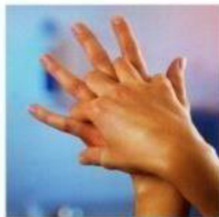
Правая ладонь на левую тыльную сторону кисти и левая ладонь на правую тыльную сторону кисти